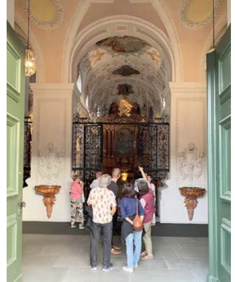
Offene Kirchentüren anlässlich der Langen Nacht der Kirchen in Luzern: «Living Stones»-Mitglieder erklären die Jesuitenkirche.

Die Besoldung der Priester ist in der Schweiz sehr unterschiedlich und besonders in den Tessiner Bergtälern ein Problem. In dem gravierend unvettergeschädigten oberen Maggiatal betreuen zwei Pfarrer gleich 16 (!) Pfarreien. Die Inländische Mission leistet dort Hilfe, da die Kleinstpfarreien nicht imstande sind, alle Aufwendungen selbst zu finanzieren. Neben dem oberen Maggiatal unterstützt die IM auch die vier Pfarreien im