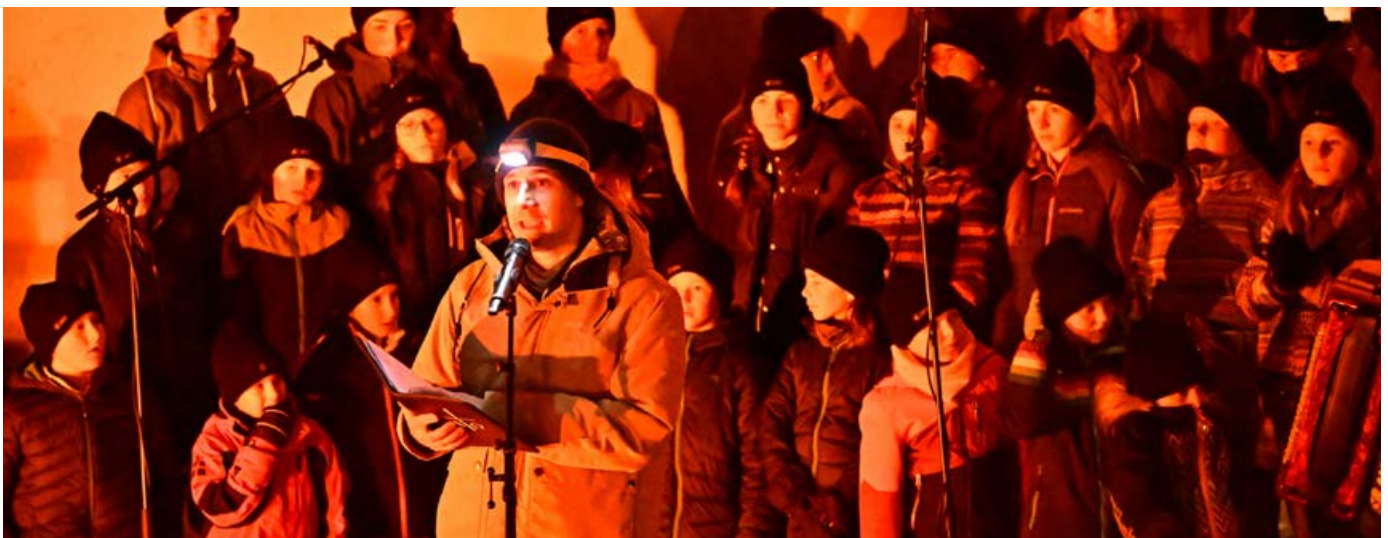
Ein Kinderchor am Ranfttreffen 2023, das jeweils von Jungwacht Blauring Schweiz organisiert wird.

Mit den Erträgen der Bettagskollekte kann die Inländische Mission in der ganzen Schweiz bedeutende Seelsorgeprojekte und religiöse Grossveranstaltungen unterstützen, die ohne die Hilfe durch die Bettagskollekte gefährdet wären. Der Vorstand und die Mitarbeitenden der IM danken zusammen mit den Schweizer Bischöfen allen Pfarreien ganz herzlich, die am Bettag selbst oder falls nötig eine Woche zuvor oder danach die Kollekte für die wichtigen Seelsorgeprojekte aufnehmen. Dieser Dank geht insbesondere auch an alle Privatspenderinnen und -spender und an Klöster und Kirchgemeinden, welche ebenfalls Beiträge ausrichten. (ufw)