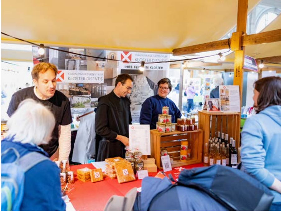
Der Klostermarkt in der grossen Halle des Hauptbahnhofs Zürich führte viele Menschen zusammen.

schen Mission in Zusammenarbeit mit dem Lehrstuhl für Kirchengeschichte an der Universität Luzern durchgeführt wurden. Für das Kapuzinerinnenkloster auf dem Gubel oberhalb von Menzingen wurde eine kirchliche Stiftung gegründet mit dem Ziel, den Verbleib der Schwestern zu ermöglichen und die Klosteranlage langfristig zu sichern. Die Inländische Mission hat sich mit weiteren Partnern bereit erklärt, dafür eine befristete Projektleisterstelle zu ermöglichen. Die Klosterlandschaft verändert sich rapide, was die Hochschule Luzern dazu bewog, in Kooperation mit dem Kloster Baldegg ein Klosternetzwerk aufzubauen, um das Zukunftspotenzial der Klöster zu identifizieren und als Ressource für unsere Gesellschaft bewusst zu machen. Auch dazu leistet die IM einen Beitrag. Die Klostertagungen an der Universität werden im Übrigen weitergeführt, die