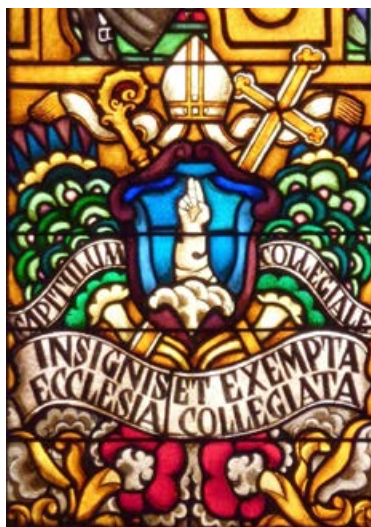
Das Wappen des Kollegiatstifts.

und Genf wurde das Projekt hinfällig. Als 1924 die Ernennung des Freiburger Stadtpfarrers anstand, überrumpelte Rom das Freiburger Stiftskapitel mit dem Erlass vom 17. Oktober 1924: Das Stiftskapitel wurde in ein Domkapitel umgewandelt, das nun je zehn residierende und nicht-residierende Domherren umfasst. Rom ordnete die mit dem 1917 eingeführten ersten allgemeinen Kirchenrecht römische Bischofsernennung auch für Freiburg an, gestand der Freiburger Bürgerschaft aber die Pfarrwahl zu und erlaubte weiterhin die Ernennung der residierenden Domherren durch die Freiburger Kantonsregierung. Das Bistum Lausanne und Genf wurde zur Diözese Lausanne, Genf und Freiburg umbenannt. Am 1. Februar 1925 ergriff Bischof Marius Besson Besitz von seiner neuen Kathedrale.