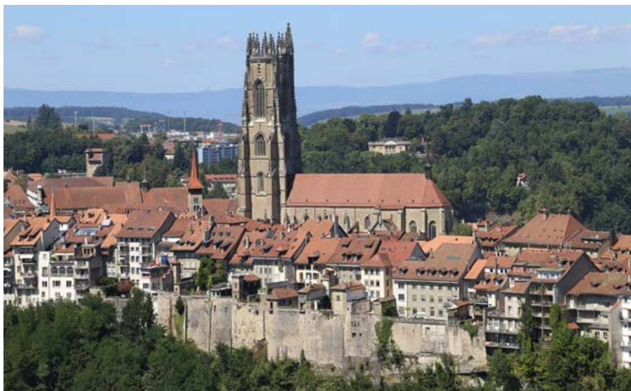
Blick von der Loretokapelle auf die Kathedrale Freiburg.

Die St.-Nikolaus-Kirche in Freiburg im Üechtland ist eine Gründung der Zähringer. Sie wurde 1182 eingeweiht und 1308/1309 von der Bürgerschaft übernommen. In deren Auftrag entstand bis 1490 in mehreren Etappen die heutige Kirche, eine hochgotische Pfeilerbasilika mit Frontturm. Der Rat errichtete 1512 ein Chorherrenstift. 1798 wurde die Kirche Kantonseigentum. Obwohl seit dem 17. Jahrhundert in Freiburg ein Bischof residiert, wurde die Stiftskirche erst 1924 zur Kathedrale erhoben. Die Kirche ist für ihre Orgel und die Jugendstilfenster des Polen Józef Mehoffer berühmt.