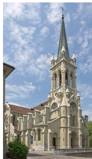
Kirche Peter und Paul.

Von der Dreifaltigkeitspfarre her wurde wegen der zunehmenden katholischen Zuwanderung der nötige Ausbau geplant, und danach wurden mehrere Pfarreien gegründet. 1939 wurden die Pfarreien im alten Berner Kantonsteil öffentlich-rechtlich anerkannt, Kirchgemeinden aufgebaut und Kirchensteuern eingeführt. 1956 erhob Pius XII. die Dreifaltigkeitskirche zur «Basilica minor». Grund dafür war die Bedeutung Berns als Bundesstadt und Ort der Diplomatie, wo auch der päpstliche Nuntius wirkt. Bern wurde so gleich behandelt wie die damalige deutsche Hauptstadt Bonn. (ufw)