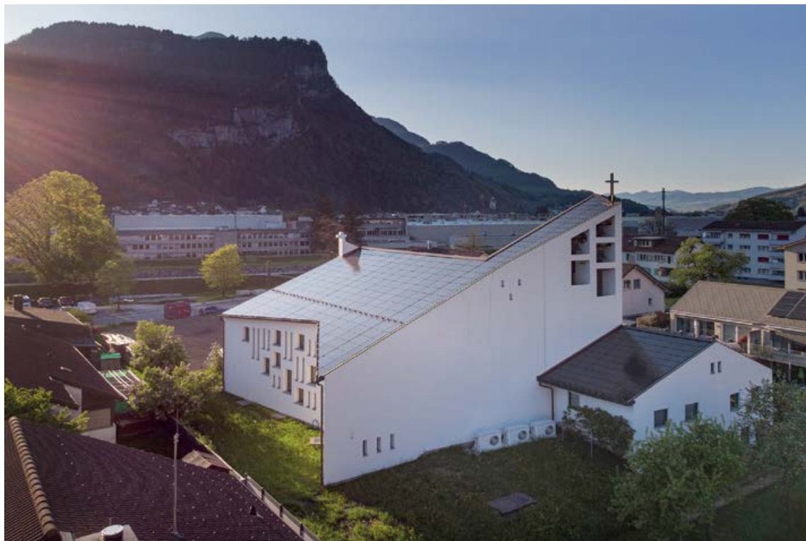
In Mollis ist man sich einig, dass die Marienkirche durch das Photovoltaikdach noch an Schönheit gewonnen hat.

Im glarnerischen Mollis musste das Dach der modernen Marienkirche ersetzt werden. Die Stiftung Marienkirche Mollis, der die Kirche gehört, hat sich für eine nachhaltige Lösung mit Solardach entschieden. In enger Zusammenarbeit mit dem Denkmalschutz wurde so ein grosser Mehrwert erreicht. Und zusammen mit der ebenfalls durchgeführten energetischen Sanierung der Kirche wurde diese dazu mit dem Norman Foster Solar Award 2023 ausgezeichnet. Die Fachstelle «oeku – Kirchen für die Umwelt» in Bern bietet allgemeine Informationen zum Thema.