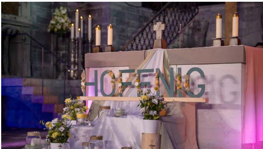
Hoffnung als Motto des Weltjugendtreffens im Mai 2024 in Chur: der Volksaltar in der Kathedrale.

Wie schon letztes Jahr unterstützte die Inländische Mission auch den diesjährigen Klostermarkt im Hauptbahnhof Zürich. Die normalerweise hektisch geprägte grosse Bahnhofshalle verwandelte sich am 14. und 15. Juni 2024 in einen Ort der Gelassenheit, wo ungewohnte Gespräche möglich wurden. Eine Besucherin dazu: «Das Betreten des Klostermarktes ist fast wie in eine andere Welt einzutauchen. Es hat eine für den Hauptbahnhof ungewohnt friedliche Stimmung geherrscht.» Die IM unterstützt diese Klosterplattform mit Begeisterung. Viele Klöster stehen vor grossen Herausforderungen, wie die bisher zwei Tagungen über die Zukunft der Klöster verdeutlichen, welche von der Inländi-