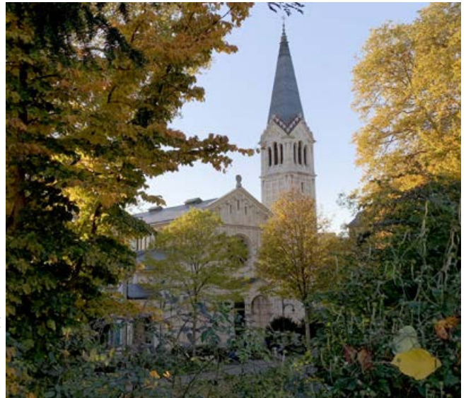
Die Stadtberner Mutterkirche, die Dreifaltigkeitsbasilika.