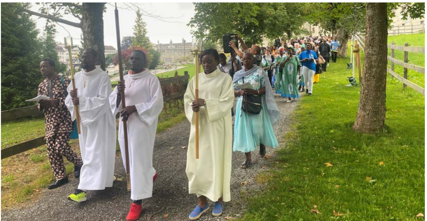
Die Afrikawallfahrt nach Einsiedeln ist mit Messe und Kreuzwegandacht vielen Gläubigen zu einer lieben Tradition geworden.

Ein Grossereignis unter diesem Motto – nach der deutschsprachigen Durchführung 2023 beim Kloster Bethanien nun erstmals zweisprachig – ist das diesjährige Metanoia-Festival (Umkehr) auf der Ebene von Vérolliez bei St-Maurice. Am fünftägigen Treffen Mitte Juli 2024 gab es Theateraufführungen, Ateliers, Konzerte, Gebetsabende, Impulse und Gottesdienste. Auch das diesjährige Festival war durch Lebensfreude, Besinnung, Spass und innere Einkehr geprägt, wie uns freudig berichtet wurde. Mit der grossen Open-Air-Show «Die Flamme der Märtyrer» wurde an die Lebenshingabe der Thebäischen Legion auf den Feldern von Vérolliez erinnert. Clown Gabidou verschob als zukünftiger Bergsteiger in seiner Vorstellung gleich die Berge und brachte das Publikum zum Lachen.